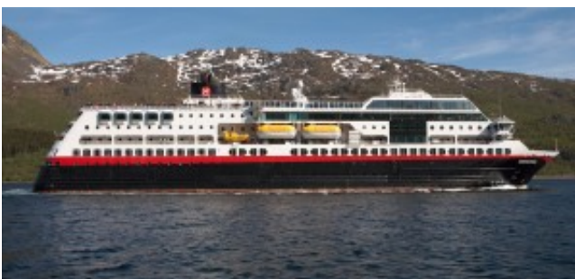
Die Mitternachtssonne scheint in MORDKAP noch