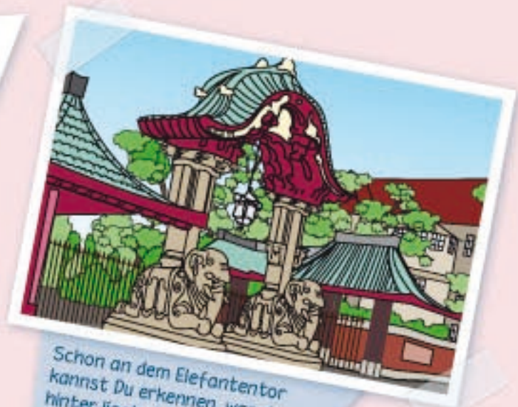
Schon an dem Elefantentor kannst Du erkennen, was dahinter liegt: natürlich der Zoo!

Was macht dir am meisten Spaß? Bist du ein Tierfreund? Dann musst du dich entscheiden: Entweder kannst du in der Nähe des Bahnhof Zoo in den artenreichsten Zoo der Welt gehen, dort findest du über 15.000 Tiere und 1.500 Arten, oder du besuchst den größten Tierpark Europas in Friedrichsfelde! Eins ist klar, tolle Abenteuerspielplätze haben beide! Wenn du dich eher für Fische, Reptilien oder Insekten interessierst, gibt es auch noch das Aquarium, du findest es gleich beim Zoo.